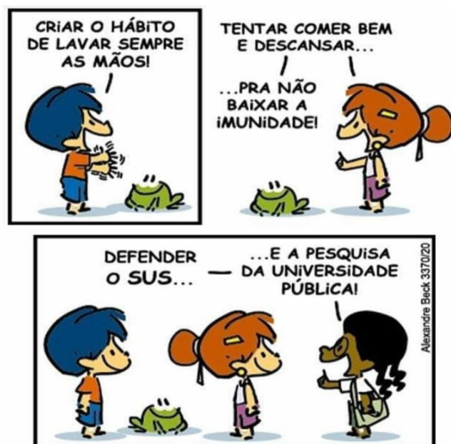
Tirinha de Armandinho

10. Leia a tirinha abaixo para responder à questão.