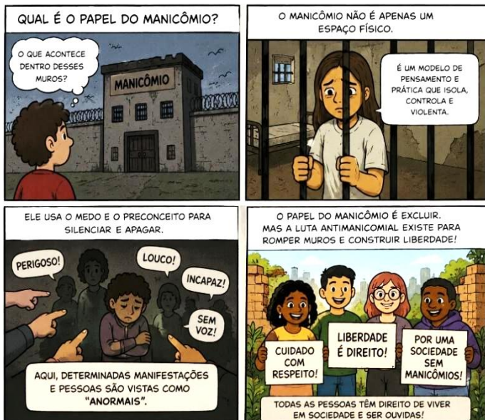
Imagem criada com auxílio da OpenAi

4. Leia a tira para responder à questão.