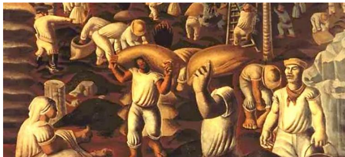
"Café" (1935) Cândido Portinari.

O ciclo do café foi um dos ciclos econômicos da história do Brasil, sendo marcado pelo predomínio do café na economia brasileira. Estendeu-se de meados do século XIX até meados do século XX. Quando o café foi o produto de maior importância na economia brasileira.