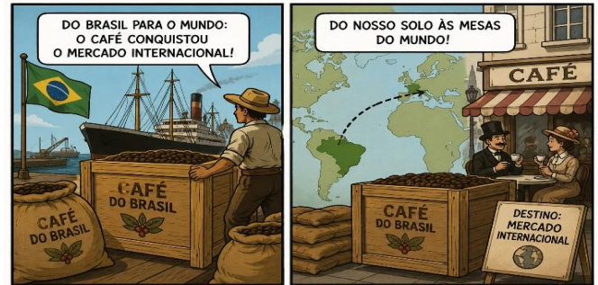
Imagem criada com auxílio da OpenAi

7. Leia a tira para responder à questão.