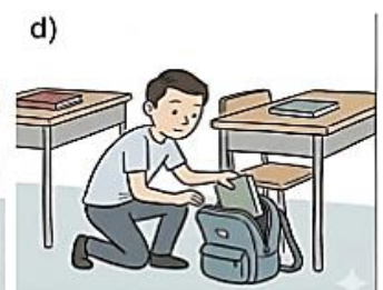
pegar os objetos da bolsa do colega sem permissão