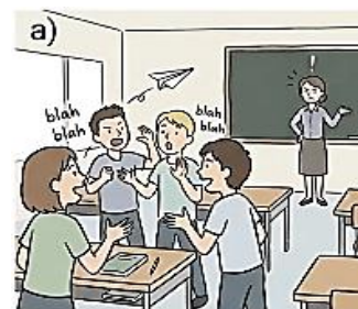
FAZER BAGUNÇA E CONVERSAR DURANTE A AULA

4. Marque a imagem que expressa uma situação de respeito.