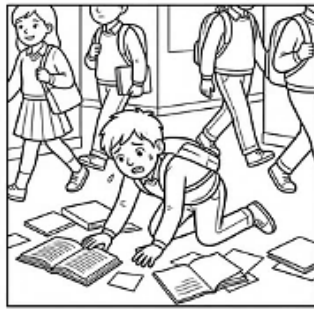
D) NÃO AJUDAR O COLEGA QUE DERRUBOU OS LIVROS.

6. Pinte as frases que representam boas ações.