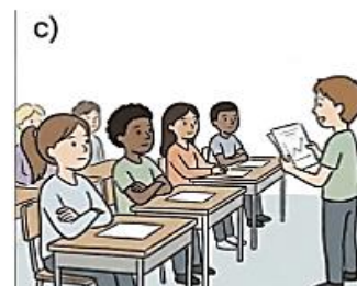
ficar em silêncio enquanto o colega se apresenta.