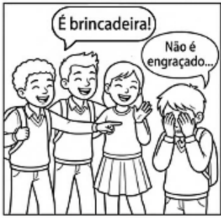
A) TIRAR BRINCADEIRAS SEM GRAÇA COM O COLEGA.

5. Pinte a situação que representa um ato de empatia.