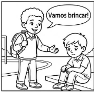
C) CONVIDAR O COLEGA EXCLUIDO PARA BRINCAR.