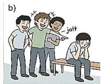
FAZER BULLYING E HUMILHAR O COLEGA