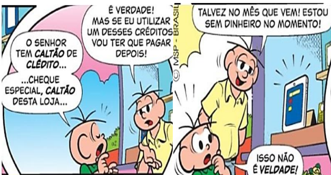
Mauricio de Sousa

O personagem prefere não usar cartão de crédito e cheque especial naquele momento. O que essa atitude mostra sobre educação financeira?