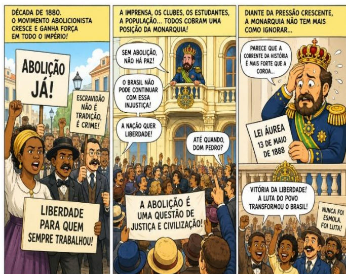
Imagem criada com o auxílio da OpenAI

2. Leia a tira para responder à questão.