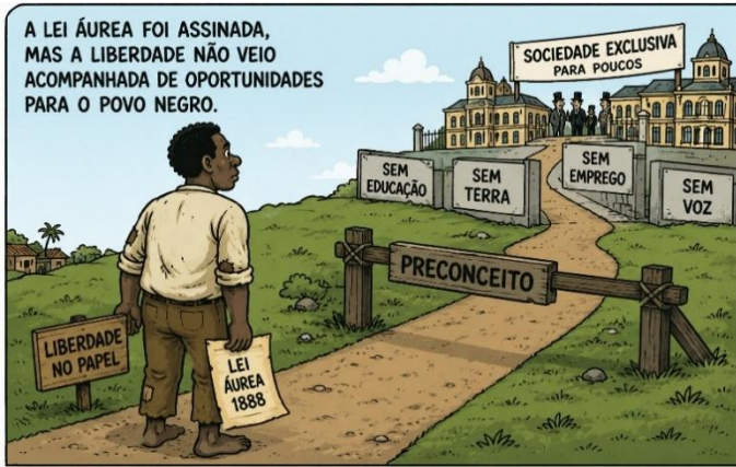
Imagem criada com o auxílio do Gemini Google

O fim da escravidão no Brasil, em 1888, não acabou com as desigualdades raciais existentes no país.