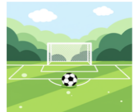
CAMPO DE FUTEBOL

3. DESCUBRA A FRASE OCULTA DE ACORDO COM A LETRA INICIAL DE CADA PROFISSÃO.