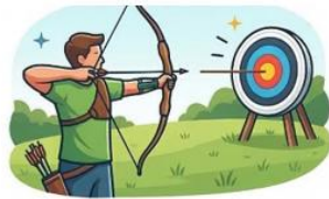
b) TIRO AO ALVO