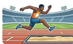
c) SALTO A DISTÂNCIA