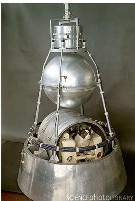
Disponível em https://www.nasa.gov/history/60-years-ago-the-first-animal-in-orbit/

Leia a matéria abaixo para responder à questão 10.