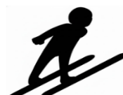
SALTOS DE ESQUI