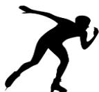
PATINAÇÃO DE VELOCIDADE EM PISTA CURTA