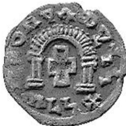
Moedas axumitas de prata do século VI.

A imagem a seguir é uma moeda do Reino de Axum datada do século VI.