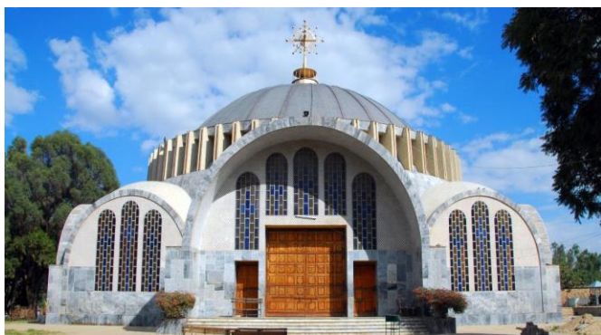
Igreja de Nossa Senhora de Sião, na Etiópia

Em novembro de 2020, algo entre 300 e 800 pessoas foram massacradas em Axum (ou Aksum). A carnificina chamou a atenção tanto pela crise humanitária como pela ameaça à rica cultura do Tigré, cujos manuscritos e outros tesouros arqueológicos podem ser destruídos ou acabar em mercados ilícitos. É em Axum que fica, por exemplo, a igreja que, segundo a tradição local, guarda a Arca da Aliança (...). A Bíblia sugere que ela desapareceu durante a invasão de Jerusalém ordenada pelo rei da Babilônia Nabucodonosor 2º, em 586 a.C.