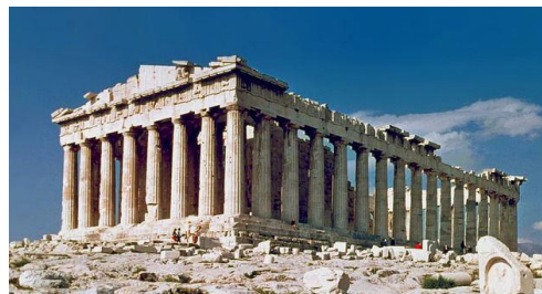
Aspecto exterior do Panteão de Atenas, na capital da Grécia

Os grandiosos templos construídos pelos gregos tinham como finalidade homenagear e cultuar seus deuses. Uma de suas principais características era o uso de colunas e a harmonia entre a entrada e a parte posterior da construção. Além disso, a arquitetura grega é marcada por edificações, como a Acrópole de Atenas, o Colosso de Rodes, a Estátua de Zeus, o Farol de Alexandria e o Templo de Ártemis.