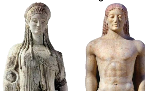
Exemplos das primeiras esculturas gregas