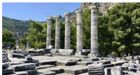
Estrutura dos templos gregos.

12. A simetria, que representa a igualdade entre duas partes, é um dos princípios fundamentais da arte grega. Complete os desenhos que ilustram a arte grega, ajustando-os para torná-los mais simétricos.