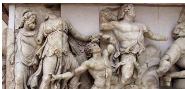
Escultura grega do período helenístico.