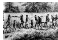
Processo de Escravidão