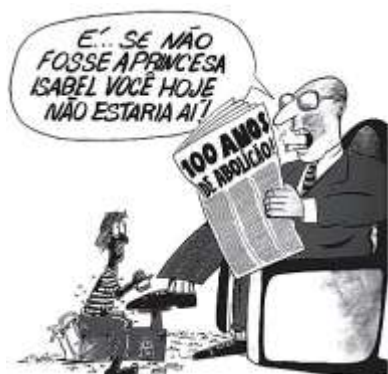
ZIRALDO. 20 anos de prontidão, 1984.

6. Leia o texto para responder à questão.