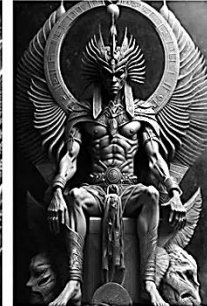
ENLIL: DEUS DO AR