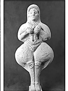
ISHTAR: AMOR E FERTILIDADE

Por ser um território de solo fértil e de fácil acesso à água, a região da Mesopotâmia atraiu muitos povos que acabavam por guerrear entre si pelas terras. Por esse motivo não se pode dizer que os habitantes da mesopotâmia eram simplesmente os mesopotâmicos, foram vários os povos que dominaram esse território, com características próprias e muito diferentes entre si.